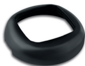
ART. P250003 Anello zavorra 8 kg Weight 8 kg