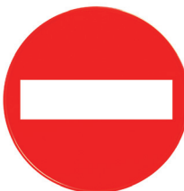
ART. P230001C Tabella tonda "DIVIETO DI ACCESSO" Round board "NO ENTRY"