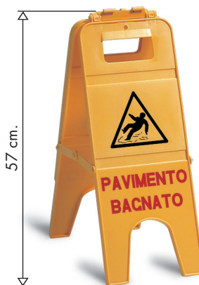
ART. 8624 Segnale di avviso a 3 ante, disponibile in varie lingue. Safety sign 3 sides, available in several languages.