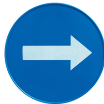
ART. P230002C Tabella tonda blu con freccia direzionale Blue round board with direction arrow