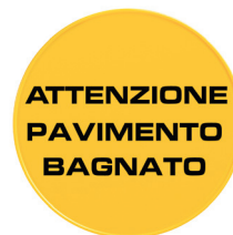
ART. P230003C Tabella tonda "ATTENZIONE PAVIMENTO BAGNATO" Round board "WET FLOOR"